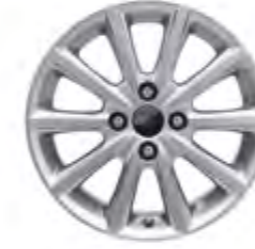
16" Alüminyum Alaşım Jant