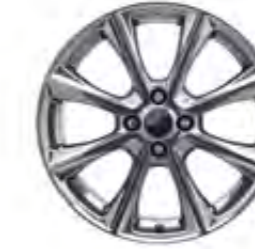
18" Alüminyum Alaşım Jant