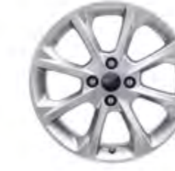
17" Alüminyum Alaşım Jant