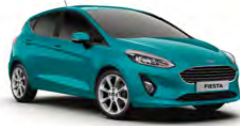
Turkuaz Mavi Özel Renk* (Trend, Titanium)