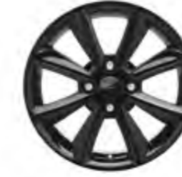
16" Alüminyum Alaşım Jant