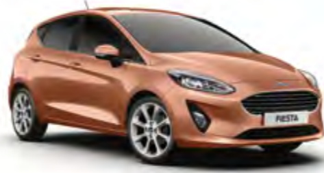
Krom Turuncu Metalik* (Trend, Titanium)