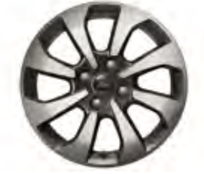
16" Alüminyum Alaşım Jant