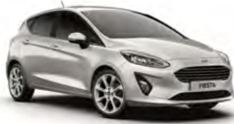
Aytozu Gri Metalik* (Trend, Titanium)