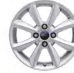
16" Alüminyum Alaşım Jant