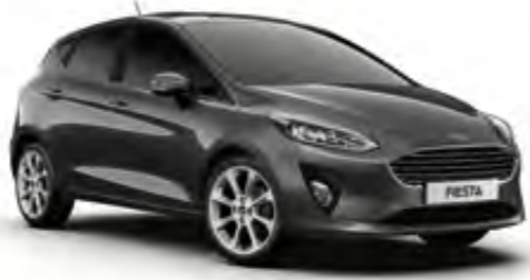
Manyetik Gri Özel Renk* (Trend, Titanium)