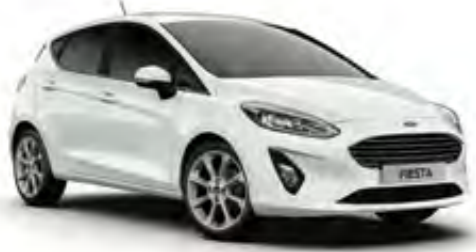
Buz Beyazı Opak (Trend, Titanium)