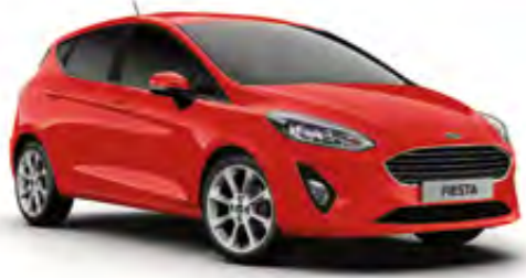
Spor Kırmızı Opak (Trend, Titanium)