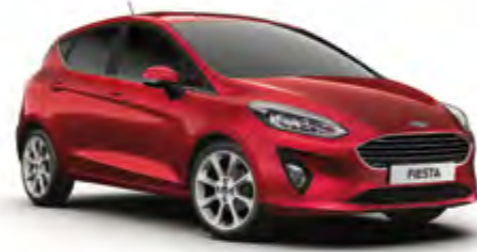
Yakut Kırmızı Özel Renk* (Trend, Titanium)