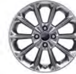
17" Alüminyum Alaşım Jant