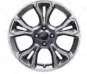
18" Alüminyum Alaşım Jant