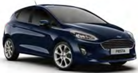
Blazer Mavi Opak (Trend, Titanium)

Bizim tercihimiz Turkuaz Mavi'den yana oldu. Peki, sizin favoriniz hangi renk?