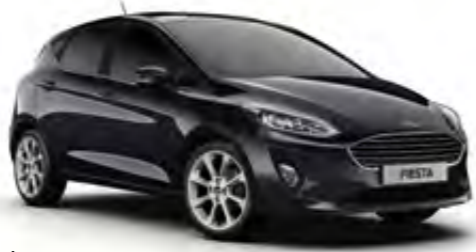
İnci Siyahı Metalik* (Trend, Titanium)