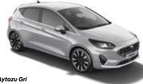
Aytozu Gri Metalik*