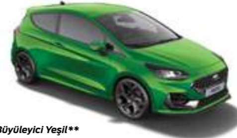
Büyüleyici Yeşil** Özel Renk*

*Ekstra ücret karşılığında isteğe bağlı donanım