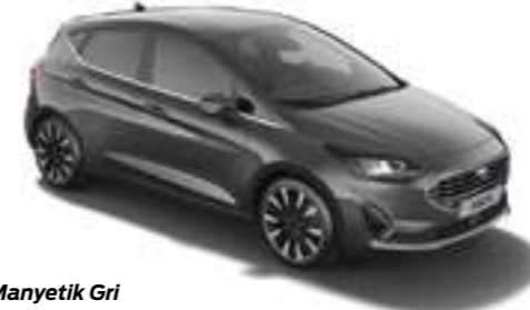
Manyetik Gri Metalik*