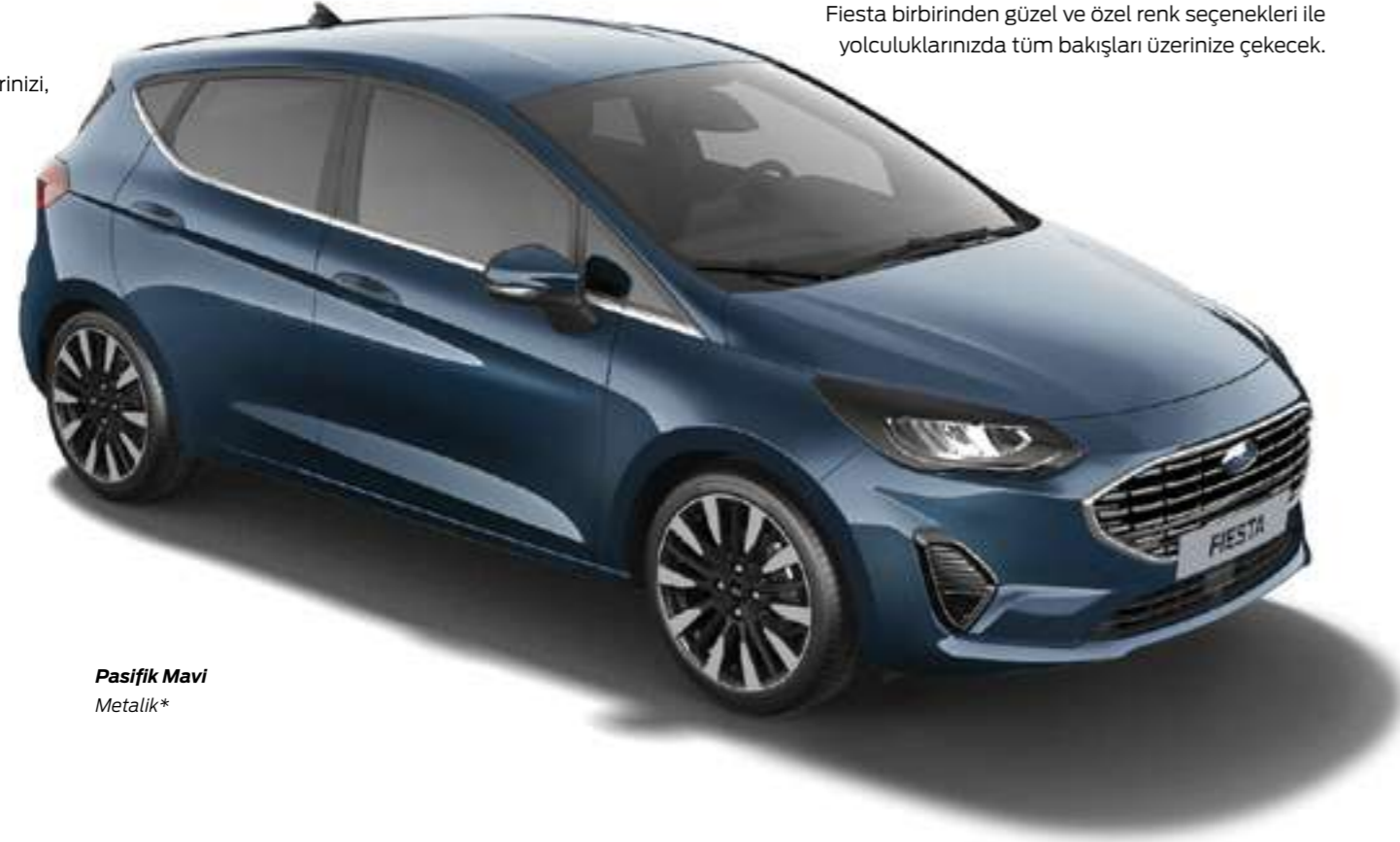
Pasifik Mavi Metalik*

Kendi renginizi, tekerleklerinizi, opsiyon ve ekstralarınızı seçerek Yeni Fiesta'ya kişiliğinizi yansıtın.