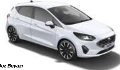
Buz Beyazı Opak

Fiesta birbirinden güzel ve özel renk seçenekleri ile yolculuklarınızda tüm bakışları üzerinize çekecek.