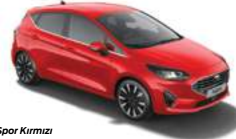
Spor Kırmızı Opak