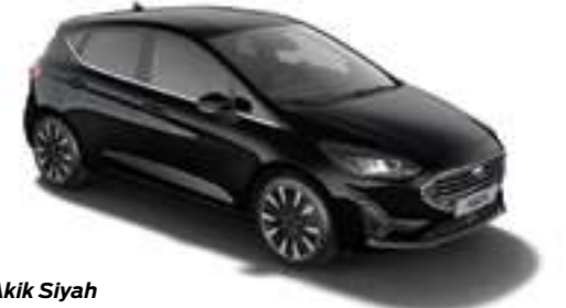
Akik Siyah Metalik*