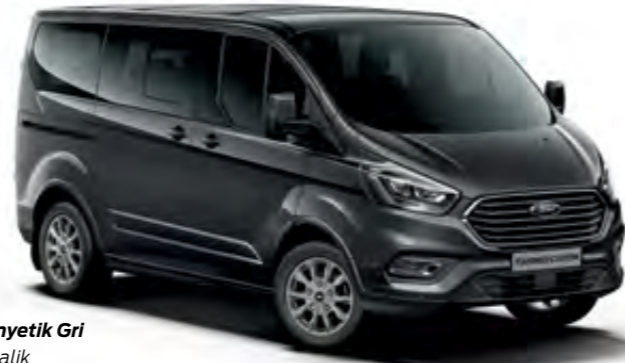
Manyetik Gri Metalik