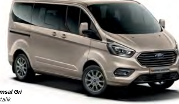
Kumsal Gri Metalik