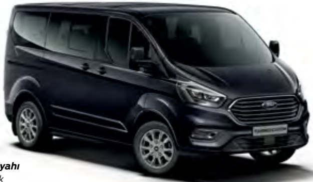
İnci Siyahı Metalik