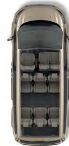
Kısa Şasi Tourneo Custom 9 koltuklu