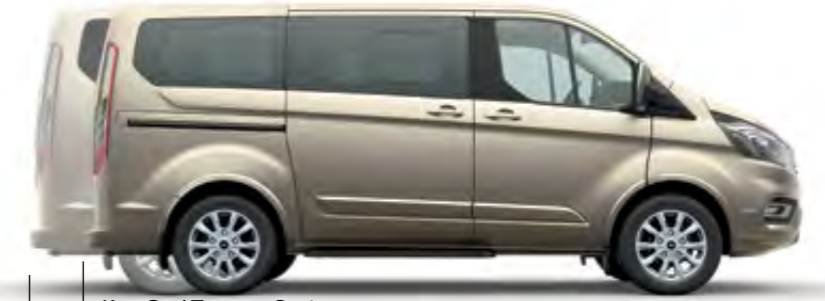
Kısa Şasi Tourneo Custom

İki farklı şasi uzunluğu sayesinde istediğiniz yükleme hacmini ve farklı koltuk düzenleri ile ihtiyacınıza en uygun oturma düzenini oluşturabilirsiniz. Birbirine bakan konferans tipi koltuklar ile iş ve tatil seyahatlerinizi, servis tipi oturma düzeniyle transfer ihtiyaçlarınızı Ford Tourneo Custom tam anlamıyla karşılıyor.