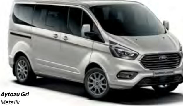
Aytozu Gri Metalik

Bizim tercihimiz Kumsal Gri'den yana oldu. Peki, sizin favoriniz hangi renk?