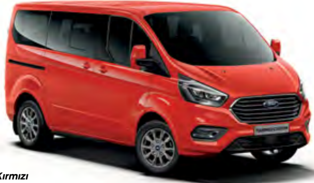
Spor Kırmızı Opak