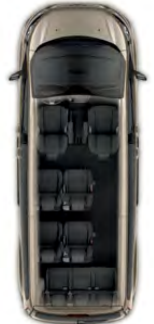
Uzun Şasi Servis Tipi Tourneo Custom 9 koltuklu

Broşürde yer alan görseller ile pazara sunulan araçlar arasında donanımsal ve görsel açıdan farklılıklar olabilir.