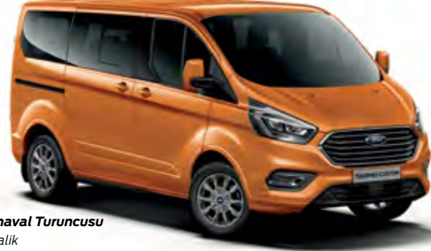
Karnaval Turuncusu Metalik