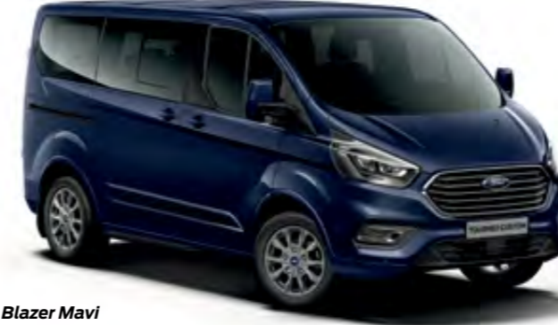
Blazer Mavi Opak