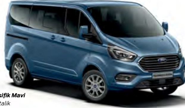
Pasifik Mavi Metalik