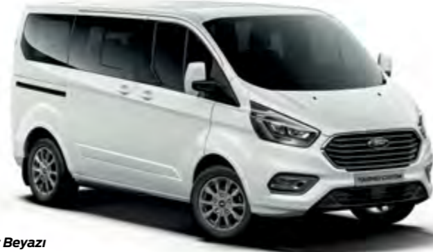
Buz Beyazı Opak