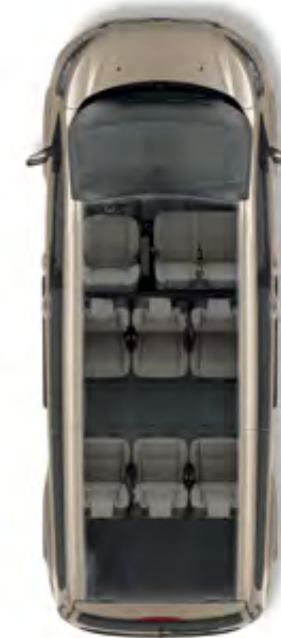
Uzun Şasi Tourneo Custom 9 koltuklu