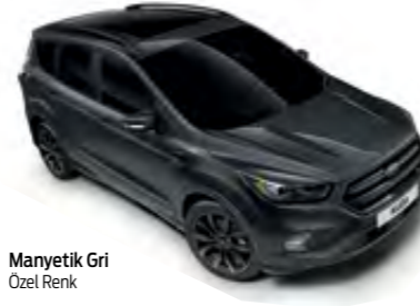
Manyetik Gri Özel Renk

* Bütün metalik gövde renkleri ek ücret karşılığında sunulan opsiyonlardır.