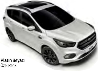
Platin Beyazı Özel Renk