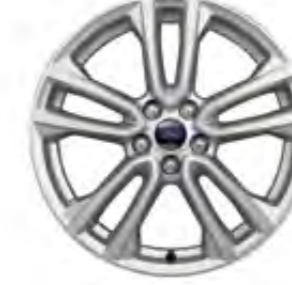
18'' Alüminyum Alaşım Jant