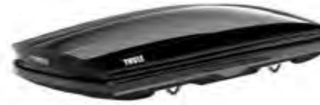
Thule® Port Bagaj Touring Sport