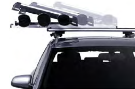
Tavan Kayak Taşıyıcı