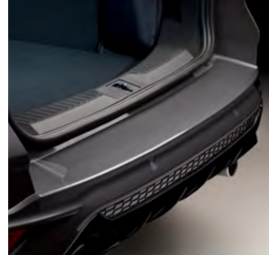
Arka Tampon Yük Koruması, folyo, şeffaf