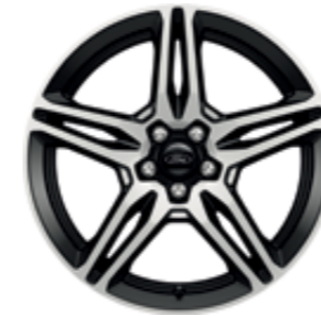
19'' Alüminyum Alaşım Jant