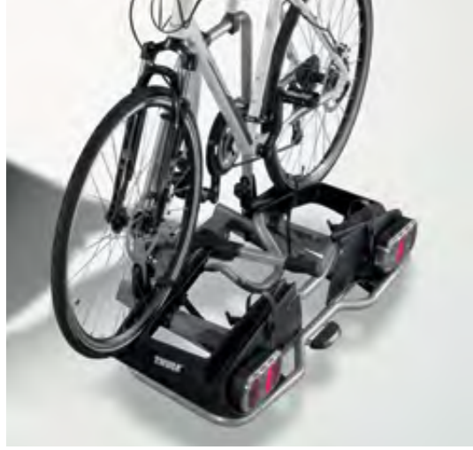
Thule® Arka Bisiklet Taşıyıcısı