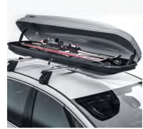
Port Bagaj İçi Kayak Taşıyıcı