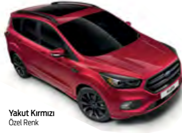
Yakut Kırmızı Özel Renk