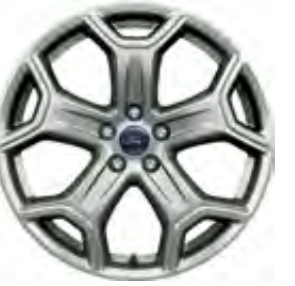
19'' Alüminyum Alaşım Jant