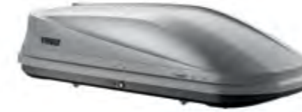
Thule® Port Bagaj Dynamic M