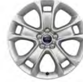
18'' Alüminyum Alaşım Jant