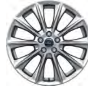
19'' Alüminyum Alaşım Jant