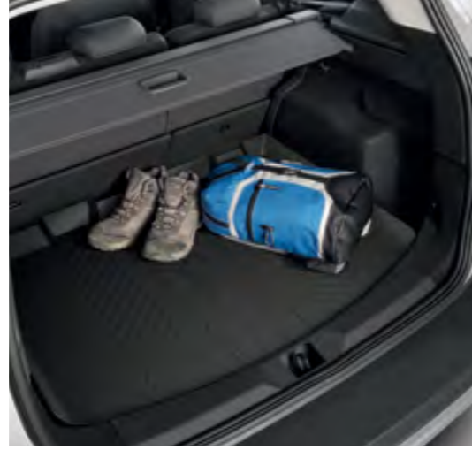
Bagaj Alanı Kaplaması