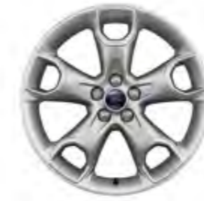
19'' Alüminyum Alaşım Jant