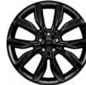
19'' Alüminyum Alaşım Jant