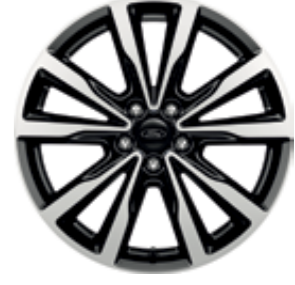
18'' Alüminyum Alaşım Jant