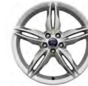
19'' Alüminyum Alaşım Jant