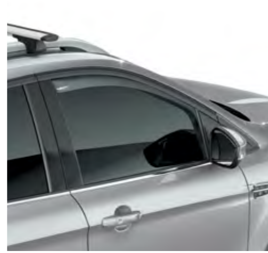
ClimAir® Cam Rüzgarlıkları